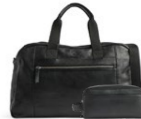
WESLEY WEEKEND BAG + DOMINIC TOILETRY BAG VEIL. UTSALGSPRIS 5.198,-