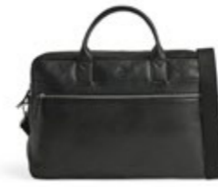
VINCENT 14" LAPTOP BAG VEIL. UTSALGSPRIS 2.999,-