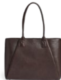
SAYA WORK BAG VEIL. UTSALGSPRIS 2.999,-