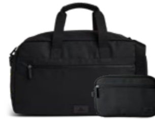
ATLAS WEEKEND BAG + SIMON TOILETRY BAG VEIL. UTSALGSPRIS 2.498,-