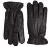
TRISTAN GLOVE VEIL. UTSALGSPRIS 499,-