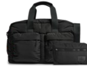
MORE WEEKEND BAG + JOSEPHINE TOILETRY BAG VEIL. UTSALGSPRIS 2.498,-