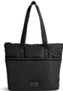
PERRY SHOPPER VEIL. UTSALGSPRIS 1.199,-