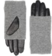
HELLY GLOVE VEIL. UTSALGSPRIS 599,-