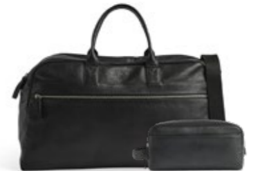
THEODORE WEEKEND BAG + DOMINIC TOILETRY BAG VEIL. UTSALGSPRIS 5.998,-