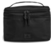
TREASURE TOILETRY BAG VEIL. UTSALGSPRIS 999,-