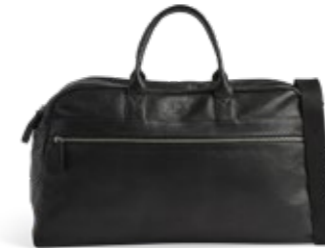
THEODORE WEEKEND BAG VEIL. UTSALGSPRIS 4.599,-