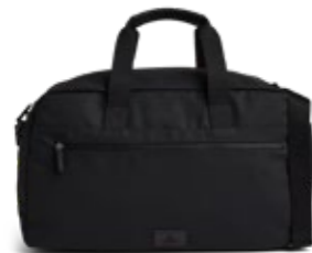
ATLAS WEEKEND BAG VEIL. UTSALGSPRIS 1.599,-