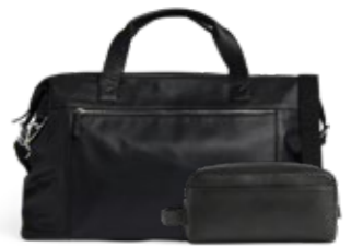
JULIAN WEEKEND BAG + DOMINIC TOILETRY BAG VEIL. UTSALGSPRIS 5.198,-