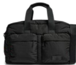
MORE WEEKEND BAG VEIL. UTSALGSPRIS 1.599,-