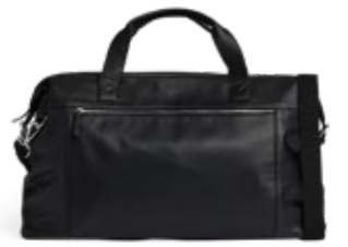
JULIAN WEEKEND BAG VEIL. UTSALGSPRIS 3.799,-