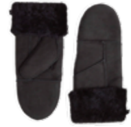
BELLA MITTEN VEIL. UTSALGSPRIS 499,-