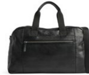
WESLEY WEEKEND BAG VEIL. UTSALGSPRIS 3.799,-