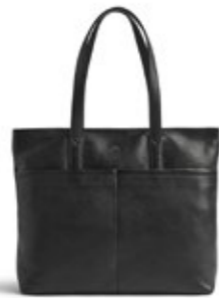
MOLINA SHOPPER VEIL. UTSALGSPRIS 2.999,-